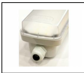
Blindstopfen für M16-Kabelverschraubung verschiedene PA schwarz M-16 – BPM-21 (60000006)

Erstellungsdatum der Karte: 13 März 2025