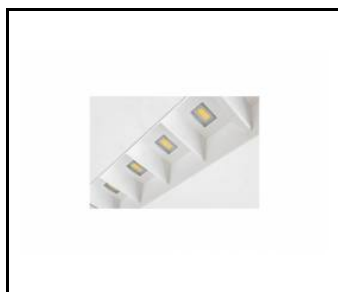
TERRA 2 LED