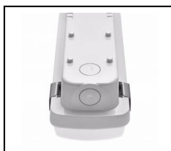
wybór miejsca zasilania / choosing a place of power supply / Stromversorgungsanschluss von mehreren Seite möglich