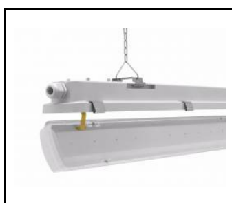
system zwieszania klosza / suspension system of the diffuser / hängende Diffusor