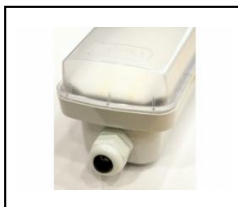
Zaślepka dławnicy M16 różne PA czarna M-16 - BPM-21 (60000006)