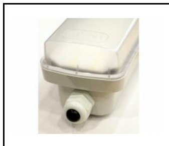
Zaślepka dławnicy M16 różne PA czarna M-16 - BPM-21 (60000006)