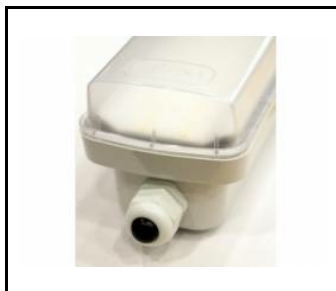
Zaślepka dławnicy M16 różne PA czarna M-16 - BPM-21 (60000006)