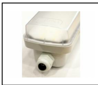
Zaślepka dławnicy M16 różne PA czarna M-16 - BPM-21 (60000006)