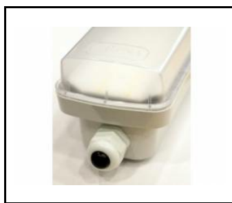
Zaślepka dławnicy M16 różne PA czarna M-16 - BPM-21 (60000006)