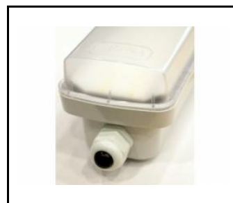
Blindstopfen für M16-Kabelverschraubung verschiedene PA schwarz M-16 – BPM-21 (60000006)

Erstellungsdatum der Karte: 19 August 2024