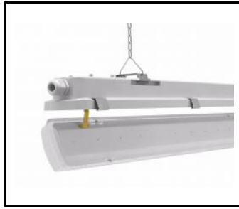
system zwieszania klosza / suspension system of the diffuser / hängende Diffusor