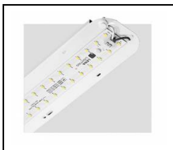
TYTAN MULTI LED 1150mm 5000-8700lm 840 - Lichtmodul (358944)