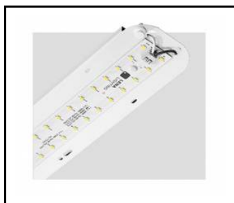
TYTAN MULTI LED 1150mm 2500-4300lm 840 - Lichtmodul (358937)