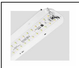
TYTAN MULTI LED 1150mm 2500-4300lm 840 - Lichtmodul (358937)