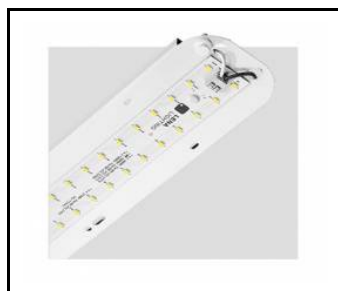
TYTAN MULTI LED 1450mm 3150-5450lm 840 - Lichtmodul (358951)