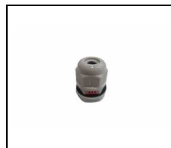
Drüse Entlüftung verschiedene grau M20*1.5 IP68 (16000507)