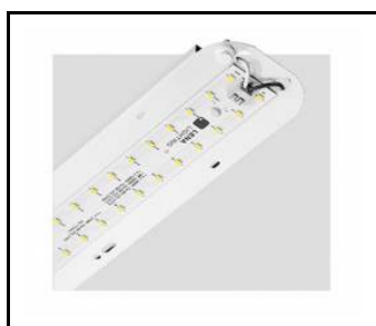
TYTAN MULTI LED 1150mm 2500-4300lm 840 - Lichtmodul (358937)