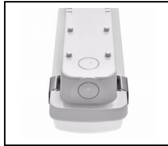
wybór miejsca zasilania / choosing a place of power supply / Stromversorgungsanschluss von mehreren Seite möglich