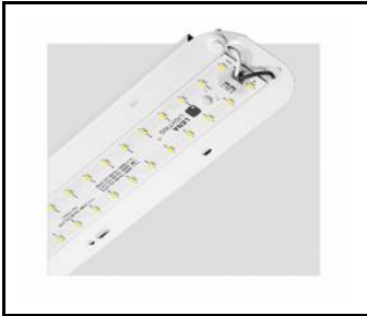
TYTAN MULTI LED 1450mm 3150-5450lm 840 - Lichtmodul (358951)