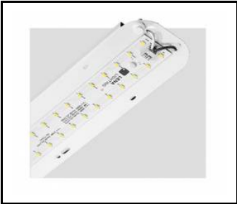
TYTAN MULTI LED 1150mm 2500-4300lm 840 - Lichtmodul (358937)