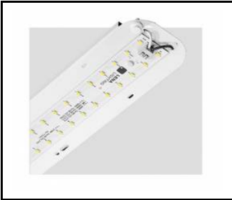
TYTAN MULTI LED 1150mm 5000-8700lm 840 - Lichtmodul (358944)