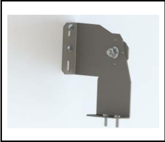
Halterung - TYTAN LED. INDUSTRY LED KOMPLET (2st.) (908200)