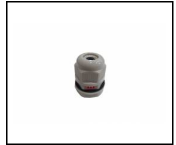
Drüse Entlüftung verschiedene grau M20*1.5 IP68 (16000507)