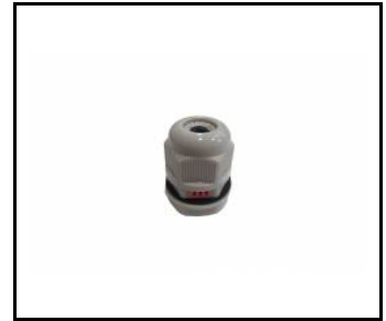
Drüse Entlüftung verschiedene grau M20*1.5 IP68 (16000507)