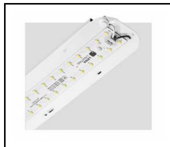
TYTAN MULTI LED 1450mm 3150-5450lm 840 - Lichtmodul (358951)