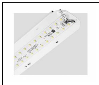
TYTAN MULTI LED 1150mm 5000-8700lm 840 - Lichtmodul (358944)