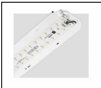
TYTAN MULTI LED 1150mm 2500-4300lm 840 - Lichtmodul (358937)