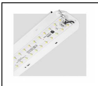
TYTAN MULTI LED 1150mm 5000-8700lm 840 - Lichtmodul (358944)