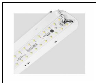
TYTAN MULTI LED 1450mm 3150-5450lm 840 - Lichtmodul (358951)