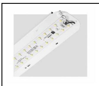
TYTAN MULTI LED 1150mm 5000-8700lm 840 - Lichtmodul (358944)