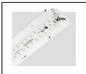
TYTAN MULTI LED 1150mm 5000-8700lm 840 - Lichtmodul (358944)