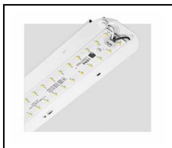
TYTAN MULTI LED 1150mm 2500-4300lm 840 - Lichtmodul (358937)