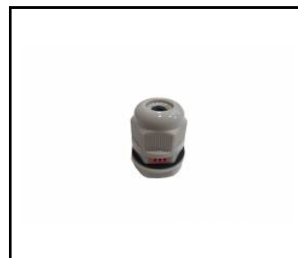
Drüse Entlüftung verschiedene grau M20*1.5 IP68 (16000507)