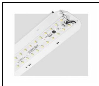
TYTAN MULTI LED 1150mm 5000-8700lm 840 - Lichtmodul (358944)