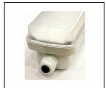
Blindstopfen für M16-Kabelverschraubung verschiedene PA schwarz M-16 – BPM-21 (60000006)

Erstellungsdatum der Karte: 08 Januar 2025