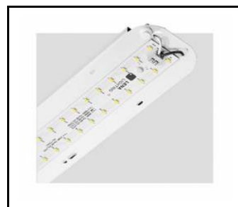
TYTAN MULTI LED 1450mm 3150-5450lm 840 - Lichtmodul (358951)