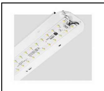
TYTAN MULTI LED 1150mm 2500-4300lm 840 - Lichtmodul (358937)