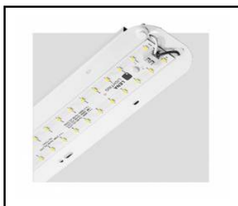
TYTAN MULTI LED 1450mm 3150-5450lm 840 - Lichtmodul (358951)