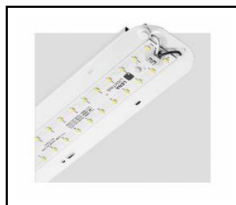
TYTAN MULTI LED 1450mm 3150-5450lm 840 - Lichtmodul (358951)