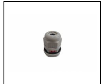
Drüse Entlüftung verschiedene grau M20*1.5 IP68 (16000507)