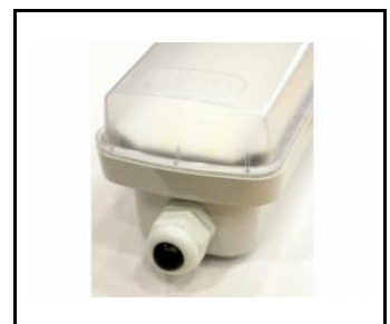
Blindstopfen für M16-Kabelverschraubung verschiedene PA schwarz M-16 – BPM-21 (60000006)

Erstellungsdatum der Karte: 08 Januar 2025