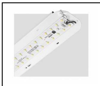
TYTAN MULTI LED 1150mm 5000-8700lm 840 - Lichtmodul (358944)