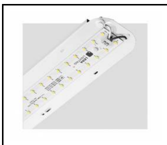
TYTAN MULTI LED 1150mm 2500-4300lm 840 - Lichtmodul (358937)