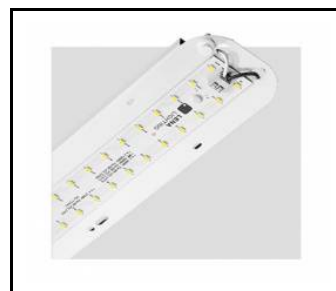
TYTAN MULTI LED 1450mm 3150-5450lm 840 - Lichtmodul (358951)