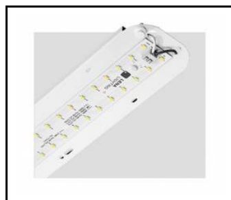
TYTAN MULTI LED 1150mm 5000-8700lm 840 - Lichtmodul (358944)