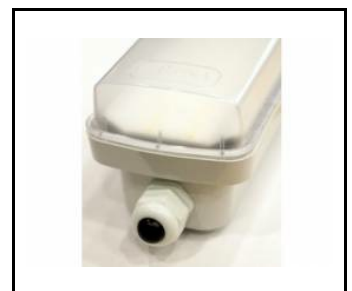
Blindstopfen für M16-Kabelverschraubung verschiedene PA schwarz M-16 – BPM-21 (60000006)

Erstellungsdatum der Karte: 08 Januar 2025