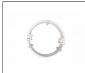
NECTRA LED IP44 20W/25W OBUDOWA NATYNKOWA PC (ø220/70) (059995)