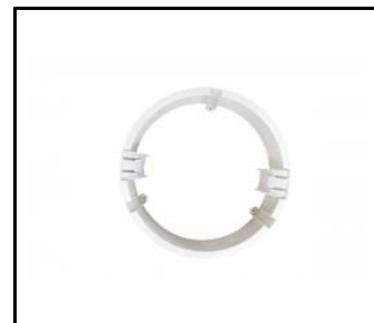
NECTRA LED IP44 20W/25W OBUDOWA NATYNKOWA PC (ø220/70) (059995)