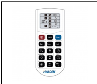
RC-Programmierfernbedienung HAI HD05R für HD0406VRH IoT (WSEL431)

Erstellungsdatum der Karte: 24 April 2026