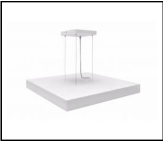
COMPACT LED EVO Z - SYSTEM ZWIESZANIA