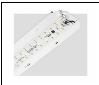
TYTAN MULTI LED 1150mm 5000-8700lm 840 - Lichtmodul (358944)