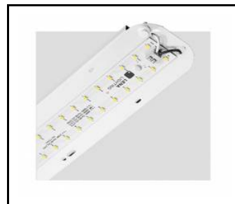
TYTAN MULTI LED 1450mm 3150-5450lm 840 - Lichtmodul (358951)