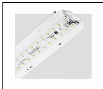
TYTAN MULTI LED 1150mm 5000-8700lm 840 - Lichtmodul (358944)