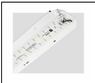
TYTAN MULTI LED 1150mm 2500-4300lm 840 - Lichtmodul (358937)