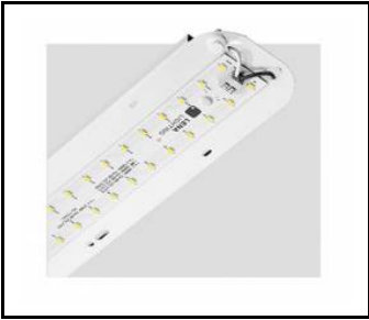
TYTAN MULTI LED 1150mm 2500-4300lm 840 - Lichtmodul (358937)