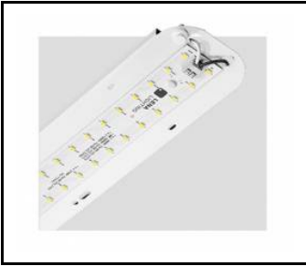
TYTAN MULTI LED 1150mm 5000-8700lm 840 - Lichtmodul (358944)