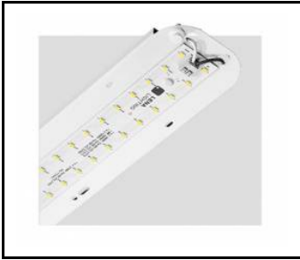
TYTAN MULTI LED 1450mm 3150-5450lm 840 - Lichtmodul (358951)