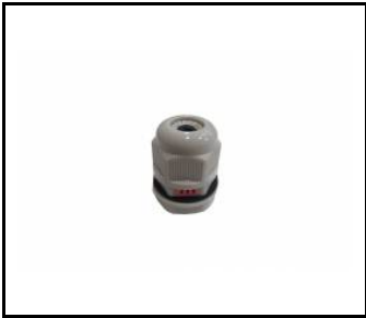
Drüse Entlüftung verschiedene grau M20*1.5 IP68 (16000507)