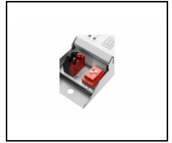
tytan multi led