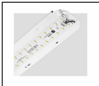
TYTAN MULTI LED 1150mm 5000-8700lm 840 - Lichtmodul (358944)