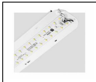
TYTAN MULTI LED 1450mm 3150-5450lm 840 - Lichtmodul (358951)