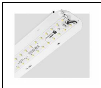
TYTAN MULTI LED 1450mm 3150-5450lm 840 - Lichtmodul (358951)