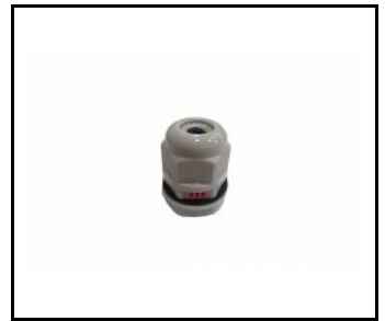
Drüse Entlüftung verschiedene grau M20*1.5 IP68 (16000507)