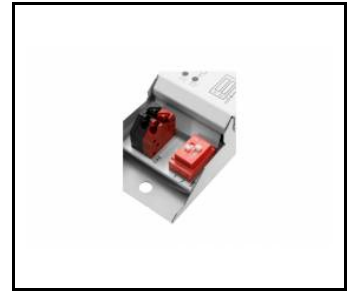
tytan multi led