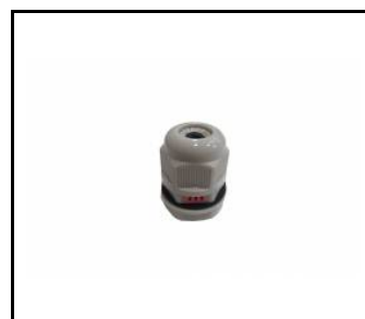
Drüse Entlüftung verschiedene grau M20*1.5 IP68 (16000507)