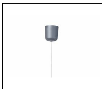
Hänge-Einzelträger (runder Kasten) (171635)