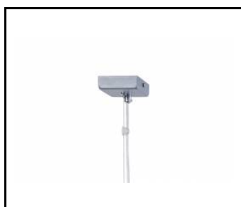
Einzelträger (runder Kasten) TABLO Einbaumontage (171710)

Erstellungsdatum der Karte: 30 April 2020