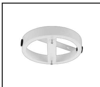
Deckenabstandshalter DOT weiß matt (551161)

Erstellungsdatum der Karte: 21 October 2024