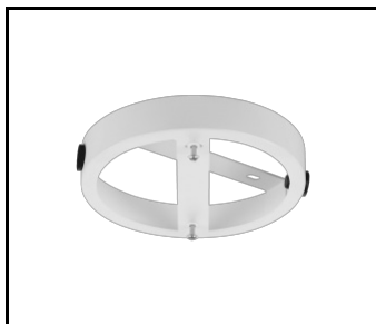
Deckenabstandshalter DOT weiß matt (551161)

Erstellungsdatum der Karte: 21 October 2024