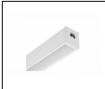
SMART LED EVO - WŁĄCZNIK