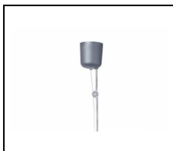
Einzelträger (runder Kasten) (171505)