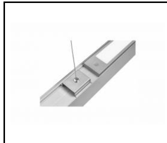
SMART LED EVO - ŚWIATŁO POŚREDNIE, SYSTEM ZWIESZANIA