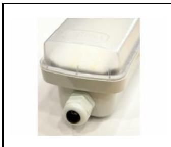
Blindstopfen für M16-Kabelverschraubung verschiedene PA schwarz M-16 – BPM-21 (60000006)

Erstellungsdatum der Karte: 19 August 2024