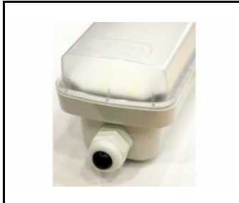
Zaślepka dławnicy M16 różne PA czarna M-16 - BPM-21 (60000006)