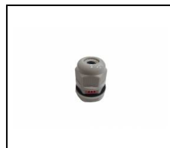
Dławnica odpowietrzająca różne szara M20*1.5 IP68 (16000507)