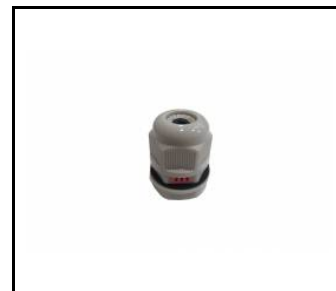
Dławnica odpowietrzająca różne szara M20*1.5 IP68 (16000507)