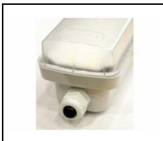
Zaślepka dławnicy M16 różne PA czarna M-16 - BPM-21 (60000006)