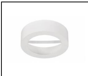
RUNDES GEHÄUSE FRAGA 15W. NECTRA 9W / 9W IP44 (059858)