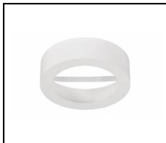
RUNDES GEHÄUSE FRAGA 6W / 11W. NECTRA 5W / 7W / 7W IP44 (059841)