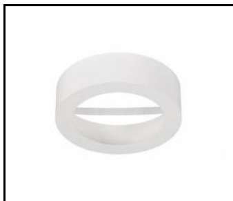
RUNDES GEHÄUSE FRAGA 6W / 11W. NECTRA 5W / 7W / 7W IP44 (059841)