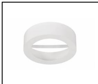
RUNDES GEHÄUSE FRAGA 15W. NECTRA 9W / 9W IP44 (059858)