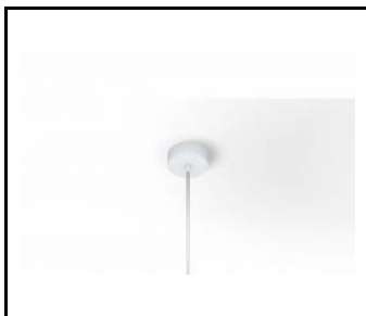
capella led z biala zwiesie

Erstellungsdatum der Karte: 02 Januar 2025