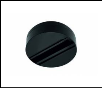
EXPO SYSTEM LED baza Anbaubasis schwarz (255106)