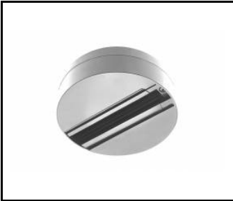
EXPO SYSTEM LED Anbaubasis weiß (255113)