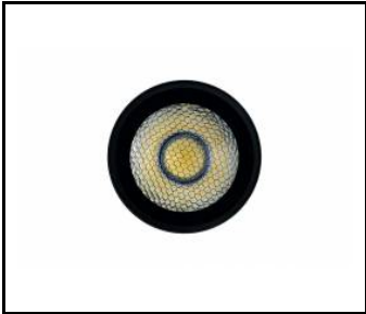
EXPO SYSTEM LED honeycomb (255120)

Erstellungsdatum der Karte: 10 Januar 2025 Der Hersteller behält sich das Recht vor, Produktverbesserungen und Designänderungen oder Modernisierung in den Produkten vorzunehmen. * Parametertoleranz beträgt +/- 10 %Das Produktdatenblatt ist kein kommerzielles Angebot.