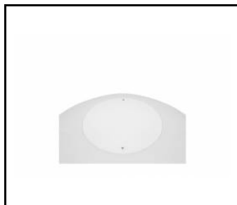
CAPELLA LED EDGE ANTIVANDAL