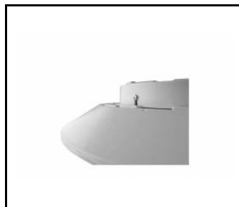
CAPELLA LED BOX ANTIVANDAL

Erstellungsdatum der Karte: 27 October 2021