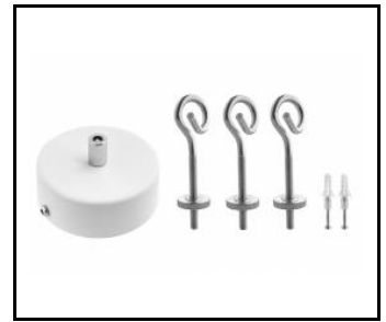
Zawiesz Coria Set 1 fi 100 schwarz dali (556678)