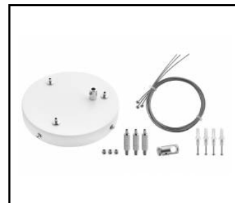
Zawieszak Coria zestaw 3 fi 150 czarny dali (556753)

Erstellungsdatum der Karte: 21 November 2023