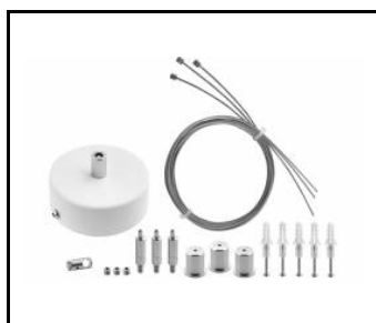
Zawieszak Coria zestaw 2 fi 100 weiss dali (556708)