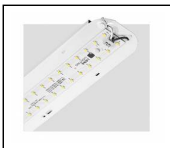
TYTAN MULTI LED 1150mm 5000-8700lm 840 - moduł świetlny (358944)