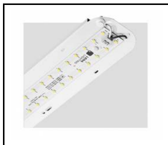
TYTAN MULTI LED 1150mm 2500-4300lm 840 - moduł świetlny (358937)