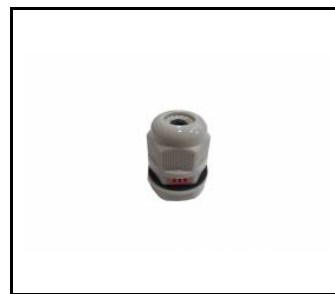
Dławnica odpowietrzająca różne szara M20*1.5 IP68 (16000507)