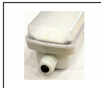
Zaślepka dławnicy M16 różne PA czarna M-16 - BPM-21 (60000006)