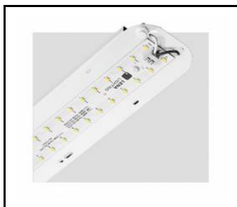
TYTAN MULTI LED 1150mm 5000-8700lm 840 - moduł świetlny (358944)